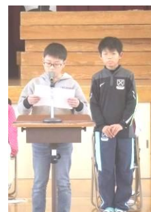
会長立候補と推薦者の8名(左端)と当選した4名の立候補者と推薦者(右4枚)

立候補した子どもたちの目標、したいことを聞いていて、心強く感じたことがいくつかあります。その一つは、言葉です。目標の中に、「学校へ恩返しをしたい」「人の役に立ちたい」「(自分の足の故障を述べた後) みんなが支え合う学校を創りたい」「明るく、元気に、思いやり」など、輝く言葉がたくさんありました。二つ目は、姿勢・礼儀正しさです。担任の先生に指導されているとは言え、礼もあいさつもしっかりとできていました。三つ目は3年生のしっかりと演説を聴く姿勢です。これも初体験でしたが、がんばっていましたね。