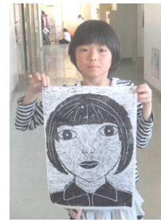
インクを塗って(左)完成へ(右3枚)