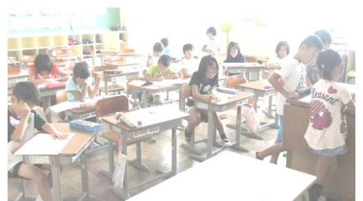
夏休み勉強会にて 7/27 1B(左上) 2C(右上)