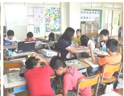
夏休み勉強会にて 7/27 3B(左上) 4A(上 中央) 5B(右上)