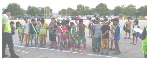
第39回飯田市伊勢市小学生交流会へ出発 8/4明野小3名(上) おばたまづくり協議会主催親子映画会7/30 映画の前の〇×クイズ(左2枚)