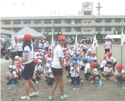
(決勝係の6年生と先生 写真右の左側)