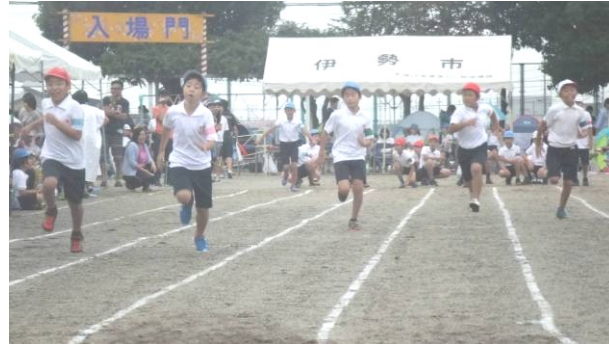
(5年男子の力走 写真右上)