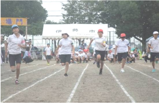
(5年女子の力走 写真左上)