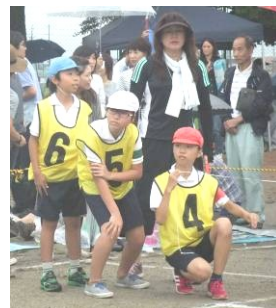
(走り終えた1年生を誘導する6年生女子 写真左)

徒競走や学年の競技を支える5・6年生の係も笑顔で動き、係をするときの真剣なまなざしは写真を撮っていてもすてきでした。準備と後片付けをする係、出発係や招集・誘導係はどの競技にも登場していましたね。