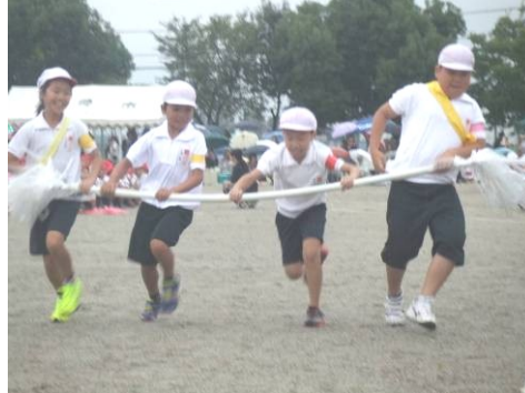
(白組アンカー 写真中)