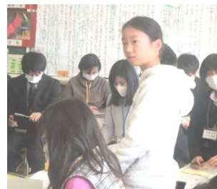
仲間の意見を聞き、さらに自分の意見を言う(上)