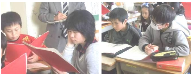
授業の最後の思いを込めたペアでの朗読(上)

大造じいさんを目の前にした残雪の姿が、頭領としての威厳を示すにいたるまで、次第に高まっていく『すごさ』を子どもたちは十二分に理解していました。「プライド」「心が強い」という言葉も出され、子どもたちの多くの思いも変容していったことも分かります。