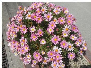
花々は満開の季節を迎えました

「暑さ寒さも彼岸まで」という言葉があります。「冬の寒さ（余寒）は春分頃まで、夏の暑さ（残暑）は秋分頃までには和らぎ、すごしやすくなる」という意味の言葉です。確