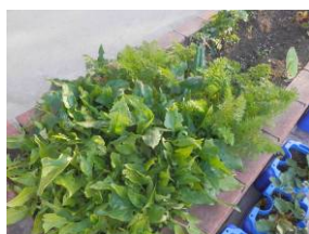
ほうれん草と人参

大根の葉は、とてもよく茂っていて、これからの成長が楽しみです。また、ほうれん草や人参も、大根に負けず劣らず、深緑の元気な葉を空に向けて広げています。