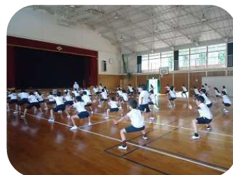
4～6年生の表現種目の練習風景