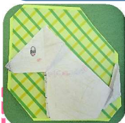
3年生Aさんの折り紙作品