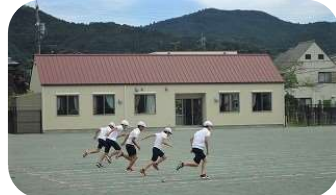
徒競走は 全学年50m走