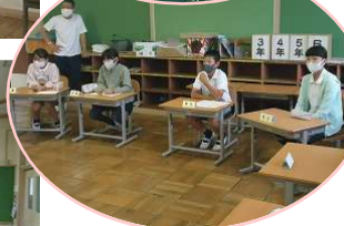
児童会代表委員会の様子です