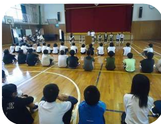
選挙管理委員会のメンバーもしっかりと立会演説会を進めました★