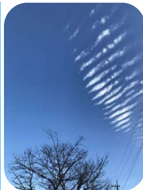
ふしぎな雲が見えた朝

それでも、学校が再開してからは、進修小の児童のみんなと「新しい生活様式」を守りながら、充実した学校生活を送ることができました。よくがんばりましたね！