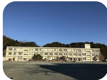
登校するとすぐに元気に遊ぶ子どもたち