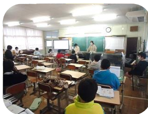
間隔をとって演奏中！5年生

冬休みが明けて10日余りが過ぎました。毎日、子どもたちの元気な声が校舎や運動場で聞こえています。職員みんなで、当たり前毎日の送れるありがたさを心から感じています。引き続き、保護者や地域の皆様のご理解とご協力をよろしくお願いいたします。