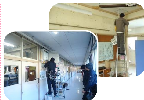
寒い中、工事をしていただきました

年明けから、回線工事が始まり、18日(月)にひと通りの作業が完了しました。この後は、iPad が届くのを待つばかりとなりました。みんなが授業や家庭学習でどんな風に使っていくのか、とても楽しみです。(6年生のみんなは、中学校に入学後も別の iPad を使うことになります。)