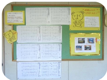
4年生は漢字学習に集中しています。満点がとれた人のプリントが掲示されています! やる気満々の姿がとてもすてきです。校長室に見せに来てくれた人もいました☆☆☆