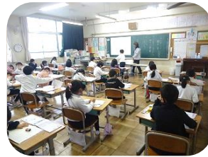
冬休みの絵日記発表中！1年生