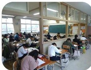
漢字テストに集中！3年生