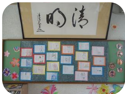
「現代版の『枕草子』春は…」5年生