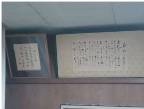
〔校名出典（左）と校歌（右）〕