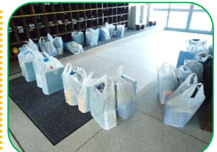
1年生のアサガオ栽培セット