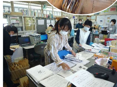
先生たちは課題の準備中