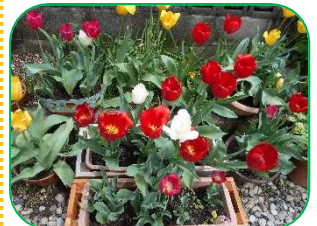
チューリップがみんなを待っていたけれど…(;v:)