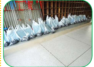
2年生の夏野菜栽培セットなど