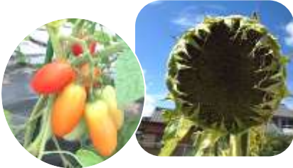
ミニトマトもつやつやの赤色に

42日間の夏休みが終わりました。みんなの元気な笑顔を見てほっとしたところです。お盆近くになって台風の影響で天気が不安定になり、思うように外で活動できなかったという人もいるかもしれません。それでも夏休みだからこそできたこと(1学期の復習や自由研究、体験学習や運動やなど)もたくさんあったのではないかと思います。事故や病気もなく、安全に健康に過ごすことができた修道小の仲間に関心しています。本当によくがんばりました!