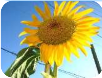
ヒマワリは自分から太陽に向かって!