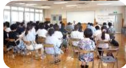
意見交換で学びを深めました