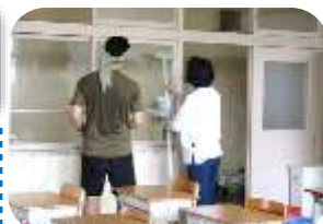
いつもの掃除ではなかなかできないところをピカピカに!

夏休みに入ってすぐの7月22日(土)にPTA活動の一つとして学校環境整備作業を行いました。汗だくになって窓ガラスや手洗い場などを丁寧に美しく磨き上げていただきました。保護者の方と一緒に参加してくれた子どもたちもいました。お忙しい中ご協力いただき本当にありがとうございました。