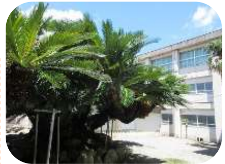
猛暑に負けず植物がたくましく育ちました!