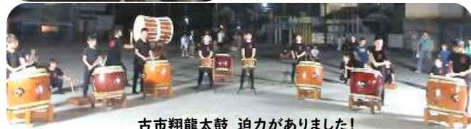
古市翔龍太鼓 迫力がありました!