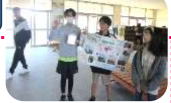
児童会のあいさつ運動の様子です