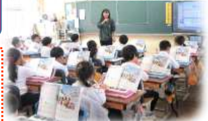
鍵盤ハーモニカも上手に吹けるようになったよ!(1年生)

新しい年が始まったら、新しい気持ちで、できることを増やしたり、これまで「できなかったこと」に挑戦したりしてほしいなと思います。そのためにも、みんなには元気に過ごしてほしいです。それが先生たちの一番の願いです!