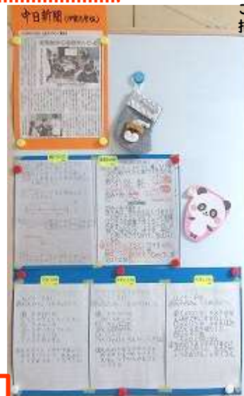
こんなにかわいらしいパンダを描いてくれたよ!(2年生)