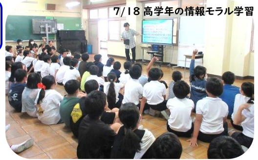
7/18 高学年の情報モラル学習