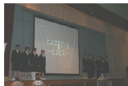
とよはまピース とよビス