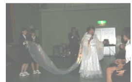
ミセス オン ステージ