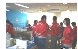
PTAの皆さん、ありがとうございました。