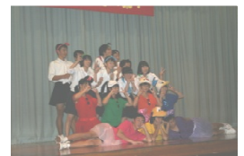
たいやまとゆかいな仲間たち